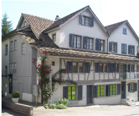
Die Galerie im Zürcher Seefeld © ART FORUM UTE BARTH

http://www.utebarth.com/presse.htm (frei zum Abdruck bei Berichten über die Galerie, Messe oder die Ausstellung)