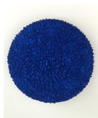
Dieter Kränzlein Ohne Titel, 2015 Marmor, blau gefärbt Durchmesser 33 cm