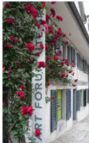
Ein historisches Haus aus dem 17. Jahrhundert Kartausstrasse 8 (zum 1. Mal erwähnt im Stadelhofer Plan 1650)